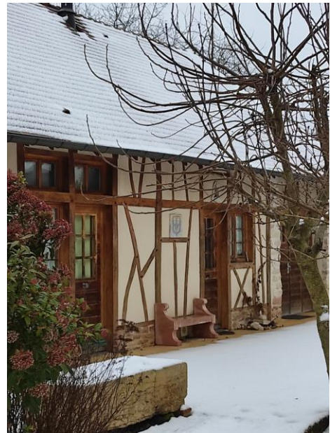
Route de Dijon Maison dite « Les Poulots »