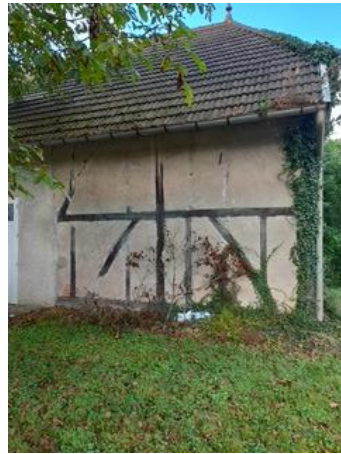
1, Rue de l'Abreuvoir Maison d'habitation.