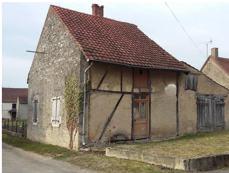
Rue des Creux Maisonnette habitée jusque dans les années 1980.