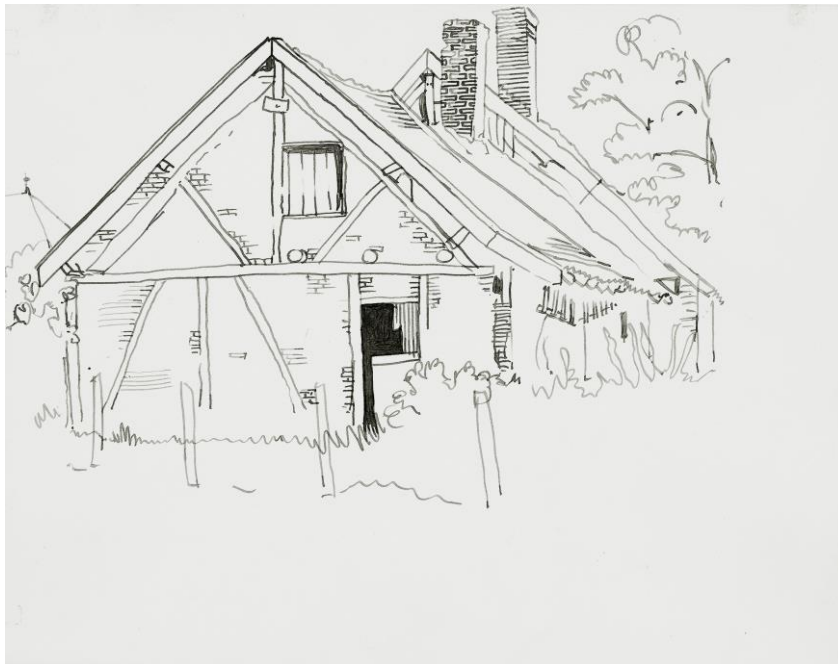
Dessin de l'abbé Garneret

Dans l'almanach franc-comtois « BARBIZIER » de 1963, un dessin de l'abbé Garneret (le fondateur du musée des maisons comtoises à Nancray) montre une ancienne maison à pans de bois de Saint-Aubin. Non daté, le croquis a probablement été tracé dans les années 1960. Cette maison semble avoir disparu. Jusqu'au 19 e siècle pourtant, une bonne partie des maisons du village étaient bâties avec les matériaux locaux, en particulier le bois des forêts de Saint-Aubin, bien plus étendues qu'aujourd'hui. Selon Alphonse Rousset : « Les maisons de Saint-Aubin étaient autrefois construites en pans de bois et en briques, et couvertes en chaume. Plusieurs incendies considérables, qui se sont succédés à des époques rapprochées, notamment en 1843 et 1847, ont déterminé les habitants à reconstruire leurs bâtiments en pierre et à les couvrir de tuiles. » (Dictionnaire géographique, historique et statistique des communes de la Franche-Comté).