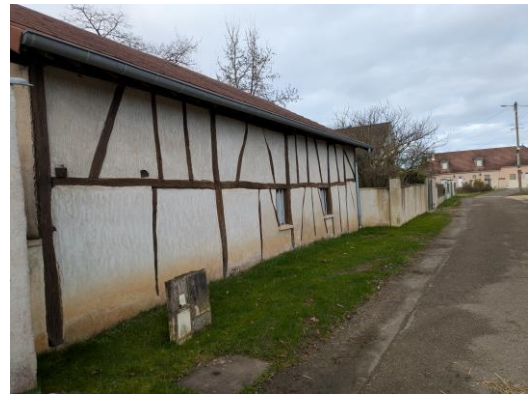
5, Rue de l'Abreuvoir