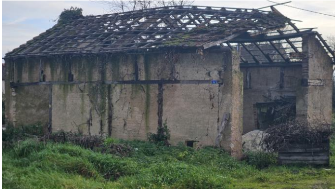
4, Rue du Stade Dépendance.