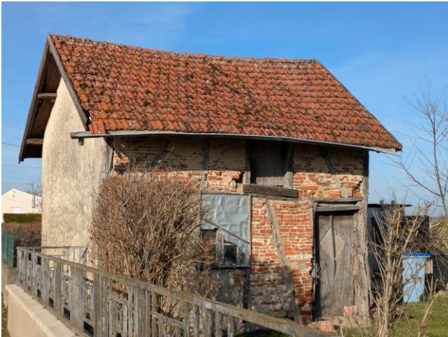
26, Route de Dijon Dépendance.